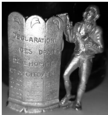
Илл. 6. Значок, посвященный Декларации прав человека и гражданина с фигурой Лафайета