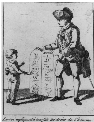
Илл. 7. Король приобщает сына к правам человека и гражданина

правовой культуры: монарх учит наследника престола азам конституционализма на примере Декларации прав человека и гражданина 1789 г. Как известно, король не разделял (по понятным причинам) идей о необходимости принятия Декларации прав человека и гражданина 1789 г. и вообще конституционных идей эпохи и прославился своей пресеченной революционным народом попыткой избежать подписания Конституции 1791 г., покинув страну. По стилю эта карикатура близка к официальным портретам: персонажи изображены без