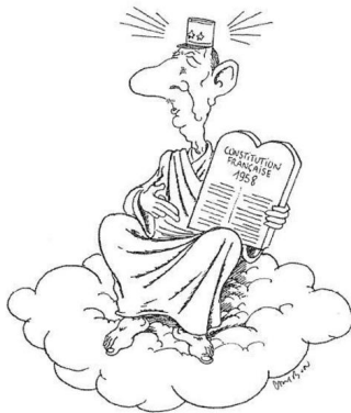
Илл. 8. Карикатура на Шарля де Голля в руках с текстом Конституции 1958 г.

правовой культуры: монарх учит наследника престола азам конституционализма на примере Декларации прав человека и гражданина 1789 г. Как известно, король не разделял (по понятным причинам) идей о необходимости принятия Декларации прав человека и гражданина 1789 г. и вообще конституционных идей эпохи и прославился своей пресеченной революционным народом попыткой избежать подписания Конституции 1791 г., покинув страну. По стилю эта карикатура близка к официальным портретам: персонажи изображены без