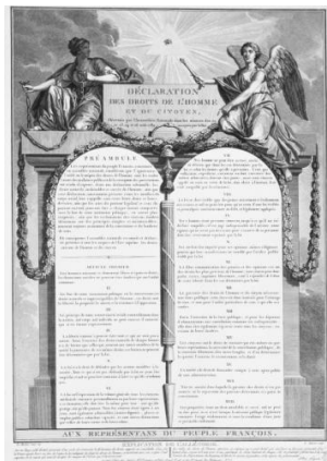
Илл. 1. Декларация прав человека и гражданина из собрания музея Карнавале

Для того, чтобы понять феномен изображения конституции в виде скрижалей и раскрыть культурно-духовное содержание такого изображения основного закона страны, необходимо обратиться к анализу происхождения термина и понятия «скрижали», их использованию в различных сферах жизни.