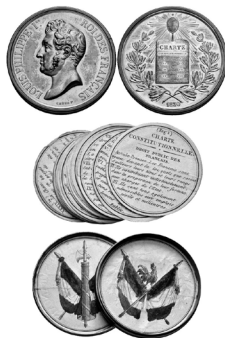
Илл. 4. Медаль, посвященная Конституционной Хартии 1830 г.

В качестве примера медали в данной статье избрана медаль, посвященная французской Конституционной Хартии 1830 г. На реверсе этой медали изображен портрет французского короля Луи Филиппа, окруженный данной надписью, на аверсе – скрижаль Конституционной Хартии, обрамленная оливковыми ветвями. Над скрижалей изображено сияющее зеркало Истины. Символика достаточно помпезная, но данная медаль представляет собой интерес в другом плане.