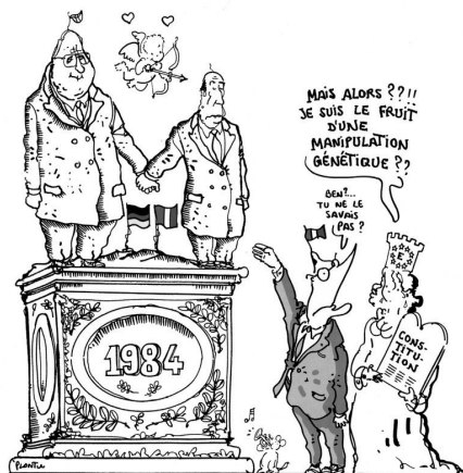
Илл. 9. Без названия

вестного исторического персонажа короля Франции Луи Филиппа Бурбона, получившего с легкой руки карикатуристов прозвище «король-груша». Парящий над мужчинами Амур символизирует полную гармонию между ними, подчеркивая единство, казалось бы, несоединимого: последнего главы монархии во Франции и главы республиканского государства. Не менее выразителен образ статуи, олицетворяющей Европейский союз, которая, глядя на союз этих мужчин, высказывает догадку, что она, таким образом, является «плодом генетических манипуляций», и однозначный ответ в форме вопроса сопровождающего ее (судя по флажку в его руке) представителя Франции (видимо, в органах ЕС): «А ты не знала?». Как мы видим, несмотря на явно критическое отношение карикатуриста к «генетическим корням» ЕС как организации, в которой рост надгосударственных структур не сопровождается адекватным ему ростом демократических начал, карикатурист не заостряет внимание на том факте, что реально документ, который планировался на роль конституции ЕС, принят не был.