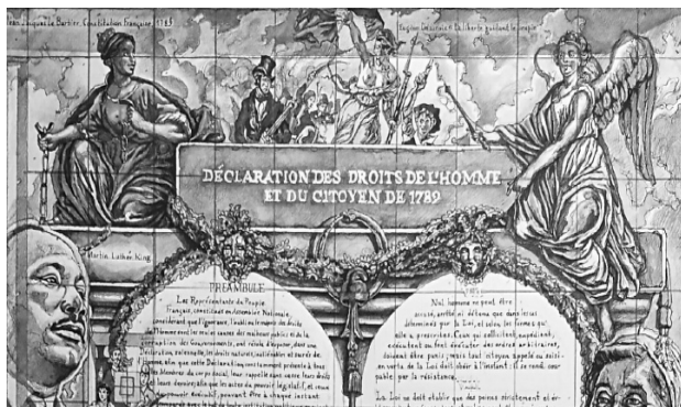
Илл. 3. С. Джеймс. Фреска, посвященная Декларации прав человека и гражданина в г. Севре

Изображения скрижалей в монументальном искусстве являются достаточно редкими, тем не менее они встречаются.