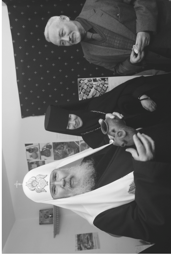
3. Москва, Зачатьевский монастырь. Игуменья Маргарита (Каледя) и Л.А. Беляев показывают Патриарху Алексию II временную выставку находок. 2006 г.