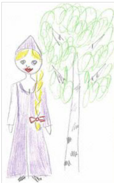
Рис. 1. Образ России в Армении. Проективный рисунок. 2019 г. (жен. 46 лет)

Влияние милитаристского имиджа России в Армении прослеживается и в рациональных категориях (вооруженные силы часто выделяли в качестве сильной стороны нашего государства), и на эмоциональном уровне – в рисунках и ассоциациях.