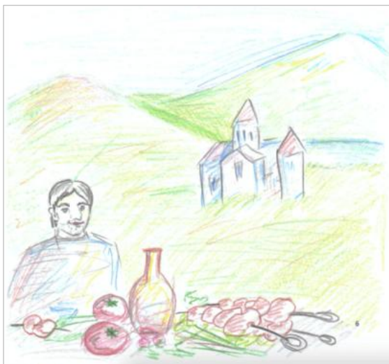
Рис. 2. Образ Армении в России. Проективный рисунок. 2017 г. (муж., 24 года)

20% составили субъективные позитивные изображения, где фигурируют люди в национальных костюмах, за накрытым столом с вином, шашлыком (см. рис. 2). В целом сюжеты были до-